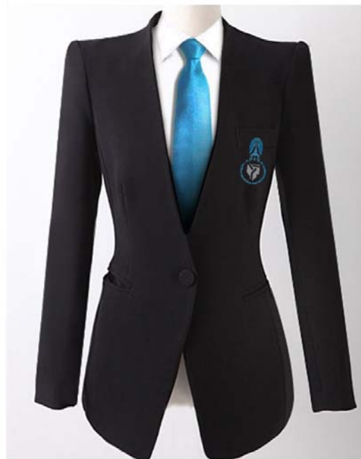
แบบเสื้อสูทสุภาพสตรี