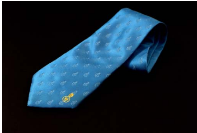
แบบเนคไท