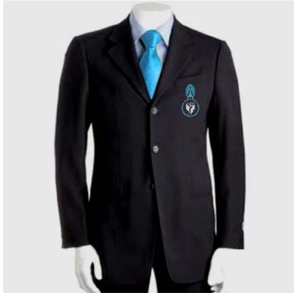
แบบเสื้อสูทสุภาพบุรุษ