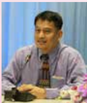
รองศาสตราจารย์ ดร.ประมาน เทพสงเคราะห์